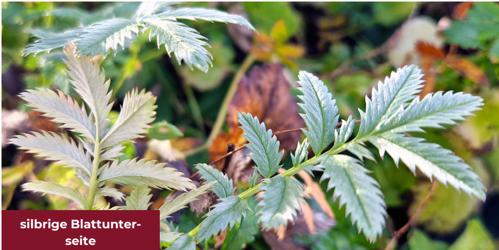
silbrige Blattunter- seite